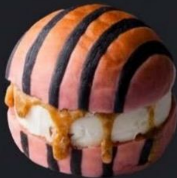
赤レンガ #KURICHI (ピーツストライプ)

プラリネ絡むピターなレモン。 特製クリームチーズにアーモンドと クルミの香ばしいプラリネをサンド。