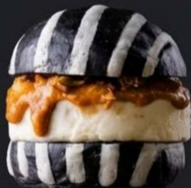
NY #KURICHI (竹炭ストライプ)

「パンでもアイスでもない」新感覚スイーツバーガー。SNSで拡散されるビジュアルと、独自レシピによる深いコク。