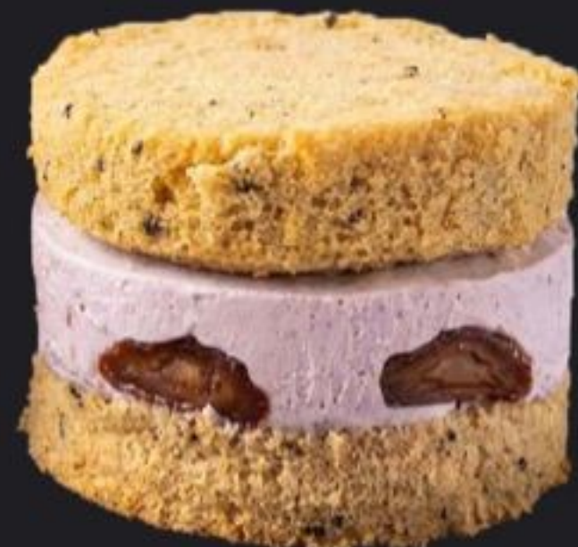
米粉 #SOICHI (紅茶香る米粉パンズ)

祝祭のオレンジプラリネ。 鮮やかな赤黒パンズと、柑橘の 明るい酸味のコントラスト。